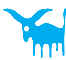
Stier 21.4. – 20.5.

Beruf, Finanzen, Gesundheit: Bereits zum Jahresanfang werden Sie ein Projekt in Windeseile über die Bühne bringen. Während andere den Sommerurlaub genießen, heißt es: noch einmal die Ärmel hochkrempeln! Unvorhergesehenes macht Ihnen einen Strich durch die Planung. Glücklicherweise sind Sie auf Eventualitäten vorbereitet. Da Sie nicht zu Extravaganzen neigen, sind auch keine Engpässe in Sicht. Sie kennen die kleinen Kostenfallen des Alltags und können ihnen daher locker ausweichen. Wichtig ist, dass 2024 der Sport nicht zu kurz kommt. Je nachdem, welcher Bewegungstyp Sie sind, werden Sie sich eine Sportart suchen, die genau Ihren Bedürfnissen entspricht.