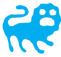
Löwe 23.7. – 23.8.

Beruf, Finanzen, Gesundheit: Bis Ende Januar sehen Ihre Bewegungen auf dem beruflichen Pfad noch etwas unsicher aus. Unter Umständen hängt das mit einer Neuorientierung zusammen, die Sie erst bewältigen müssen. Wie gut, dass Sie nicht an starren Mustern hängen, sondern sehr flexibel und aufgeschlossen reagieren. Rechnen Sie am besten gleich damit, dass Sie mehr Geld ausgeben werden, als Sie es zum Jahresbeginn geplant haben. Erkältungen werden in diesem Jahr nicht unbedingt das Thema sein. Vielmehr ist es eine allgemeine Antriebsschwäche, die sich vor allem im April und Oktober bemerkbar macht. Nutzen Sie die warmen Monate, um richtig aufzutanken.