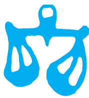
Waage 23.9. – 23.10.

Beruf, Finanzen, Gesundheit: Wenn Sie sich erst einmal für eine Sache begeistern können, gibt es keine Halten: Konzentriert und mit ganzem Einsatz verschmelzen Sie ganz mit Ihrem Projekt und vergessen die Welt um sich herum. Auch wenn es für andere vielleicht nicht so aussieht, aber tief in Ihrem Inneren scheuen Sie jedes finanzielle Risiko. Während der Januar noch als eine Art Warming-Up-Monat genutzt wird, starten Sie im Februar voll durch. Wer Sport macht, wird seltener krank. Diese Gleichung geht auf. Sollte es Sie trotzdem einmal erwischen, dann kommen Sie relativ schnell wieder auf die Beine.