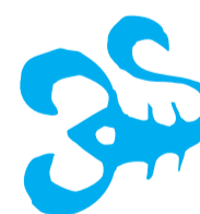
Skorpion 24.10. – 22.11.

Beruf, Finanzen, Gesundheit: Eigentlich ist es Ihnen schon jetzt klar, dass die Erfolgslorbeeren Ihnen gehören. Sie zeigen sich aufgeschlossen, interessiert und haben auch nichts dagegen, mit anderen als Team aufzutreten. Schön, wenn nun auch noch die tägliche Arbeit genau Ihren Vorstellungen und Fähigkeiten entspricht. Wer mit Anschaffungen liebäugelt, die etwas teurer sind, sollte dies auf das dritte Quartal des Jahres legen. Dann hat das finanzielle Polster an Umfang zugelegt. 2024 heißt es, mehr Selbstdisziplin zu üben! Erstellen Sie sich Ziele, die Sie erreichen wollen, und geben Sie ab sofort den Ausreden keine Chance mehr.