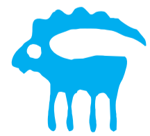
Steinbock 23.12. – 20.1.

Beruf, Finanzen, Gesundheit: Die Frühlingsmonate verstärken den Wunsch nach beruflicher Herausforderung. Erst durch die Inputs interessanter Leute entdecken Sie, dass es mehr als einen Weg gibt, der zum Ziel führt. Wann Sie bereit sind, ein Risiko einzugehen, ist lange Zeit ungewiss, aber spätestens im Juli ist ein Etappenziel erreicht. Wer nicht gerade das Glück hat, über ein prall gefülltes Sparkonto zu verfügen, sollte vorsichtig sein und eher weniger ausgeben als zu viel. Die feine Antenne, mit der Sie alles wahrnehmen, was einen negativen Einfluss auf Sie haben könnte, muss 2024 unbedingt beachtet werden. Meiden Sie Menschen, von denen Sie stark vereinnahmt werden!